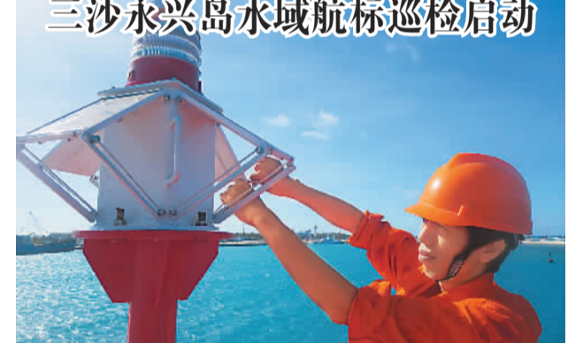
三沙永兴岛水域航标巡检启动

会议强调,必须在强化基础研究的同时,注重打通科技成果向现实生产力转化的通道,积极探索把科技成果的使用权、处置权和收益权赋予创造成果的单位,进一步为创新创造松绑加力。