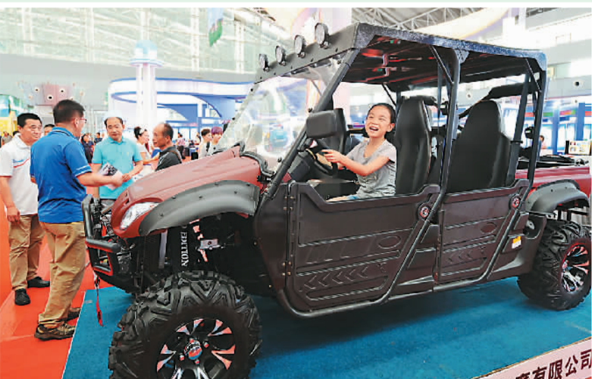
下图:一位小朋友在体验一款新型特种车辆。