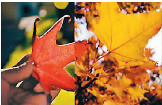
左: 圣地亚哥 右: 北京百望山

当然,在这样变幻莫测的环境下,仍有不少修成正果的例子,他们用亲身经历讲述着:留学时期,我们是怎样很好地守护了已有的爱情。