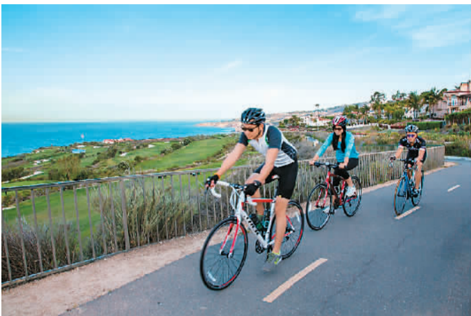
图为“单行道”成员通过骑行的方式配合线上活动，以引起更多人关注公益。