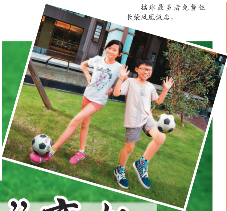
踢球最多者免费住长荣凤凰饭店。