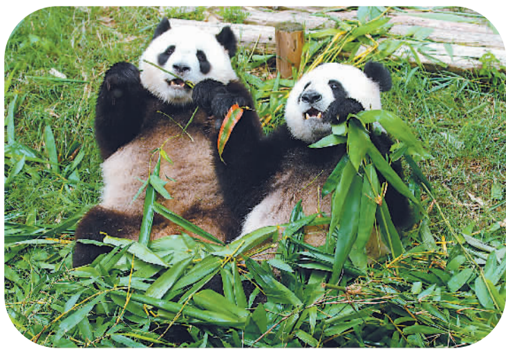
初到澳门的「开开」「心心」。乐悠悠

澳门特区政府民政总署于22日深夜召开紧急记者会，宣布中央人民政府赠予澳门特区的雌性大熊猫“心心”于22日晚8时18分因肾衰竭并发出血性肠炎，经抢救无效死亡。民政总署正和成都专家小组一起，进一步详细检查化验，以确认“心心”真正死因。