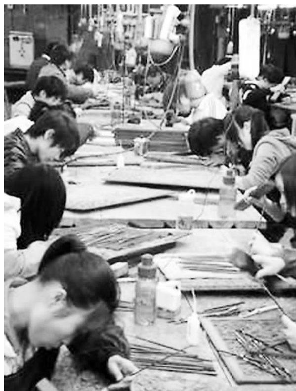
图为工人正在加工制作红木家具。

“中国古典家具之都”、“中国古典家具收藏文化名城”、“中国仙作红木家具产业基地”——2013年,福建省莆田市仙游县接