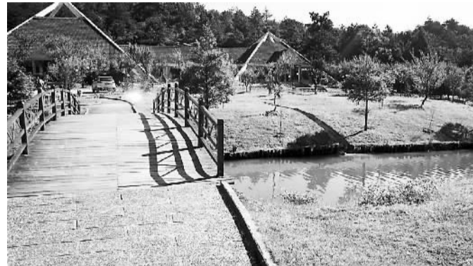
上图:龙岩冠豸山风景区一角。 压题照片:永定土楼

调研期间,苏树林对“清新福建”品牌评价颇高。他认为,这个品牌很好,很符合福建特点,要紧紧围绕它、打造