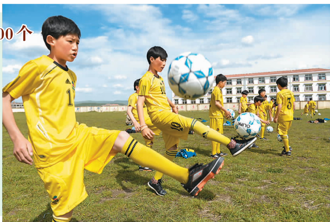
图为6月16日,四川红原县环溪镇易地小学西行驿站猎鹰足球队队员在进行颠球技能训练。该足球队由该校二年级至五年级40名身体素质优秀、爱好足球运动的藏族学生组成。

刘鹏介绍,截至2012年底,全国共有体育社会组织23590个,其中体育社团15060个,体育类民办非企业单位8490个,体育基金会40个。此外,全国全民健身活动站点超过25万个,网络体育组织达到80多万个,各级各类青少年体育俱乐部超过6000多个。目前,全国注册培训的公益性社会体育指导员已达141万人,职业社会体育指导员达7万多人。