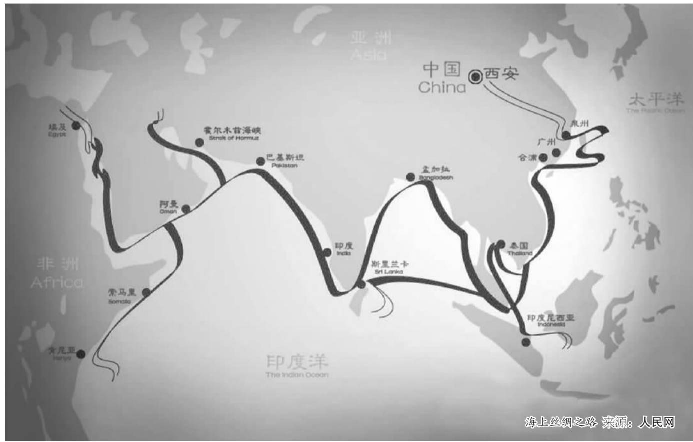
海上丝绸之路