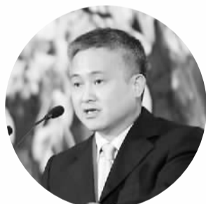
潘功胜 ——中国人民银行副行长

本次论坛提出了一个非常好的题目，叫做“金融服务经济，财富创造未来”，正是这个题目标志着财富管理不是富人的游戏，不是资金的单纯运作。目前在国内存在一个矛盾，即一方面很多投资者找不到合适的投资对象；另一方面很多企业感到融资难。造成这一现象的原因是金融市场当中的一种或明或暗的刚性兑付，使得一些领域能够高价吸收资金，减少了实业发展的资金可获得性。此外，过度依赖担保使资金配置效率低下。对担保的依赖忽视了对企业现金流的分析，促进了信贷的盲目扩张，经济下行期会对企业形成加倍的打击。所以说，应该让银行回归经营信用的本质，为有市场发展的企业提供融资的便利。