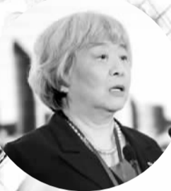
吴晓灵 ——全国人大财经委员会副主任委员、中国人民银行原副行长

财富管理市场的发展，有可能重新塑造金融业的产业链、价值链，协同与合作有了更多的可能性和空间。在财富管理的语境下，直接金融与间接金融之间，证券业与银行业、保险业、信托业之间，可以看到更多的共通点而不是差异。不同金融业态之间的协同与合作，有了更大的空间、更多的机会。早在2007年，深交所就开始思考如何构建一体化交易平台，打造金融超市。随着大财富管理时代的到来，国务院批准设立青岛财富管理金融综合改革试验区，这恰逢其时。青岛有区位优势、悠久的历史、坚实的实体经济基础，正是看到这些有利的条件和巨大的潜力，中信证券、国信证券等证券公司，深度参与了青岛蓝海股权交易中心的建设。深交所也将积极发挥自身的优势，继续支持中心的发展，面向一个高度综合的财富管理市场。我们愿意与各方面共同探索，打造一个高效率的交易所交易平台。