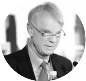
迈克尔·斯宾塞 ——著名经济学家、2001年诺贝尔经济学奖获得者、美国纽约大学经济学教授

我们所面临的一个非常重要的转型，就是中国的中等收入阶层在不断增加，这将进一步推进中国经济转型。随着这些中等收入者资产的增加，对财富管理的需求也相应增加。因此，金融服务在短期之内会有明显的收益和发展。