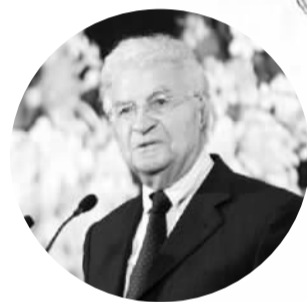
埃蒙德·阿尔方戴利 ——法国前财政部长、欧洲政策研究中心主席

青岛有非常得天独厚的环境优势，我觉得这个优势应该进一步得到利用。这里还有更多的高等院校，这都是非常重要的资产。我们不能在这里闭门造车，建立自己的财富市场，我们需要建立起一个更为广泛的生态系统，有时候需要技术，有时候需要更多金融方面的人士。