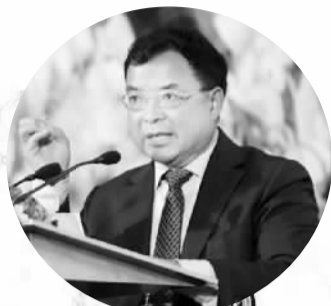
陈文辉 ——中国保监会副主席

为了进一步促进财富管理的活动，我们要打造一个能够促进投资者信心的环境，并在这个体系中建立良好的监管。青岛是一个非常具有吸引力的旅游胜地，如果我们在青岛居住一段时间的话，就会发现这座城市有着非常好的信誉。青岛在改革开放方面也做得非常好。这里有很多国际的金融机构建立起自己的业务分支，所以毫无疑问，这也是我们觉得青岛有着得天独厚的条件，能够确立自己在财富管理市场中地位的原因。