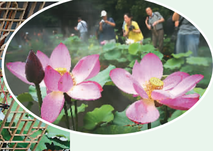
6月24日，荷红莲碧——第三届杭州西湖荷花展在西湖郭庄和曲院风荷景区开幕，为期38天的本届荷花展共展出国内外荷花、睡莲精品600余种...