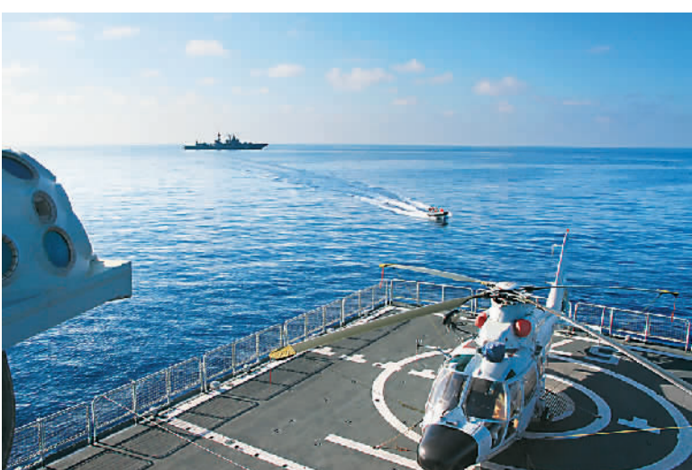
中俄双方组织联络官换乘。图为联合护航期间。

执行叙化武海运护航任务,是中国首次为化学武器销毁提供海上运输支持,也是中国海军首次与俄罗斯、丹麦、挪威等国海军在地中海进行联合行动。整个任务中,中国海军先后派出盐城舰、黄山舰与俄、丹、挪三国舰艇执行了20批联合护航任务,历时174天。