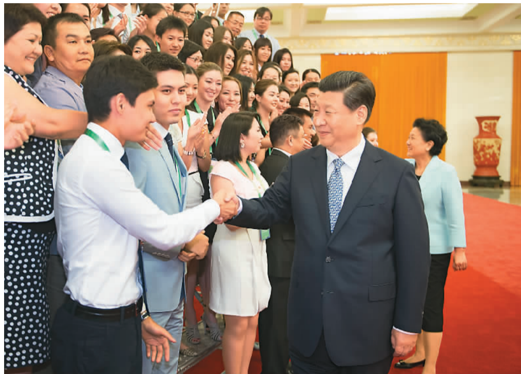
图为习近平会见哈萨克斯坦纳扎尔巴耶夫大学师生夏令营代表团。

习近平指出,中哈是友好邻邦,两国人民有着天然的亲近感。早在2000多年前,古老的丝绸之路就把我们两个民族连接起来。我同纳扎尔巴耶夫总统是亲密的朋友,我们保持密切沟通和交往,共同探讨如何推动两国关系发展,加强合作,加深两国人民之间的友好感情。国之交在于民相亲,民相亲,关键在于青年之间的交往。希望你们通过这次访问,了解一个真实的中国,留下美好记忆。相信你们今后会成为中哈友谊的建设者。