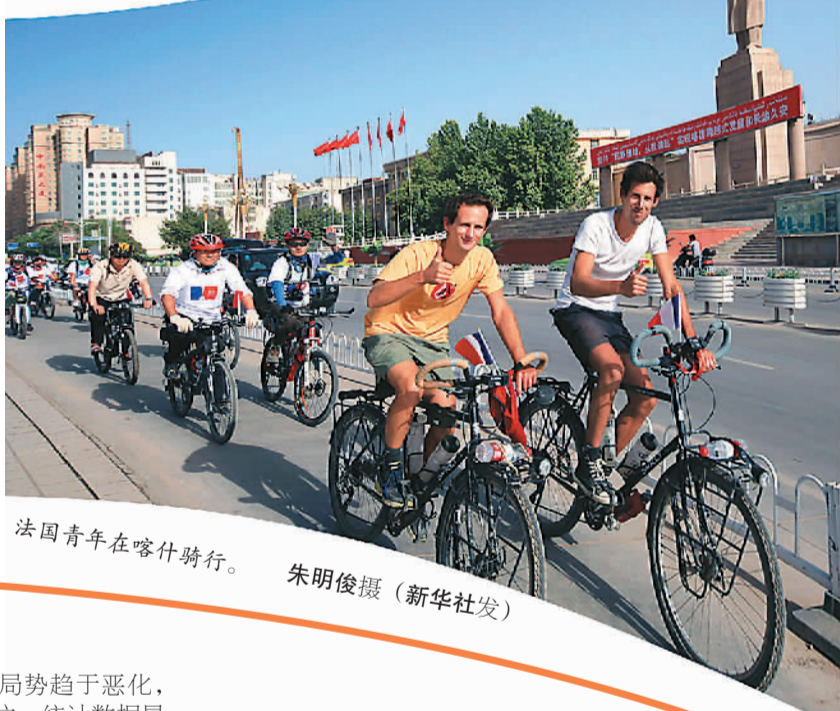
法国青年在喀什骑行。

据新华社乌鲁木齐6月20日电(记者李晓玲)夏日新疆，故城依旧、山花烂漫，国内外游客纷至沓来。近日，一支名为“上海—汉堡”的欧亚新丝路自驾探险旅游团抵达新疆喀什地区泽普县，这里拥有新疆南部首个国家5A级景区——金湖杨森林公园。迷人的自然风光、浓郁的民族风情和特色美食让团员们沉醉其中。新疆处在四大文明的交汇地，有1200多个各具特色的旅游景点。别样的旅游景致和文化，正是游客选择新疆的理由。