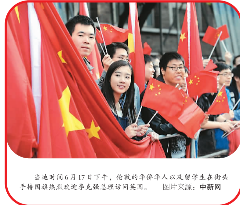
当地时间6月17日下午，伦敦的华侨华人以及留学生在街头手持国旗热烈欢迎李克强总理访问英国。

“中国亲戚”让“洋商家”赚得盆满钵满的同时，也让当地华人得到了不少就业机会。相比其他族裔，华人既懂得本地语言又对中国游客的文化和习惯有一定了解，成为导游导购等职业的最佳人选。专家表示，此次李克强总理访英带来的签证福利，将会让面临就业压力的华人获得更多的工作机会。