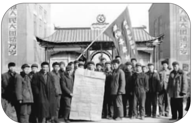
在洛矿工作期间，焦裕禄（左四）和职工合影

经过3年经济恢复，1953年，新生的共和国制定了第一个国民经济五年计划，雄心勃勃地迈出了奔向工业化的步伐。一大批重工业基地得以确立，156项由苏联援建的重点工程开建，一批批优秀的地方干部被抽调到筹建的厂区。焦裕禄就是在那年6月份从共青团郑州市委第二书记的岗位上被抽调到洛阳重型矿山机器厂筹建处的。