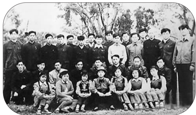
1956年7月22日，焦裕禄（中排左四）与大连起重机器厂机械车间工人文艺组合合影

焦裕禄在读小学的时候就接触了二胡，几乎无师自通。在工业文明发达的大连，他的特长再一次得以发挥：在厂报上发文章，用二胡表演节目，提出经营管理、政治思想工作等方面的建议……厂领导很快注意到了这个来自河南的实习车间主任。为此党委做了一个决定：派出两名能独当一面的工程师到洛矿工作以换取焦裕禄留下。焦裕禄婉拒了这份厚意。他对工作环境不抱怨、不提条件的品质在此后更得以发扬：6年后，组织派焦裕禄到条件最艰苦的兰考任职，他二话不说就走马上任了。