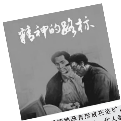
焦裕禄精神孕育形成在洛矿，弘扬光大在兰考。我们这一代人都深受焦裕禄精神的影响，是在焦裕禄事迹教育下成长的。——习近平

在共和国的历史上，英雄辈出，模范无数，但像焦裕禄这样被党的几代最高领导人一致赞颂的英雄模范还真不多。学习焦裕禄的活动每隔几年