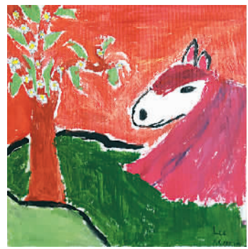
图为张月朦画的马