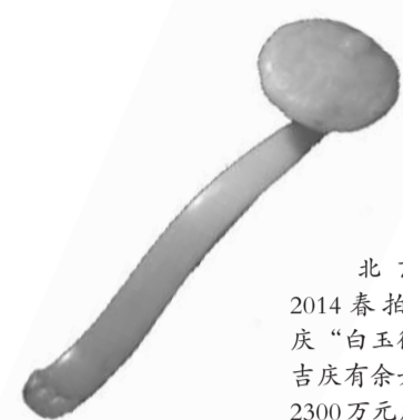
北京翰海2014春拍，清嘉庆“白玉御题诗文吉庆有余如意”以2300万元成交。

五六月间，又是一年春拍季。内地各大拍卖行鏖战正酣。此前，香港苏富比出现4件亿元拍品的盛况并未对内地市场形成强烈冲击，天价拍品尚未出现，反映出内地艺术品市场正朝着理性的方向回归。