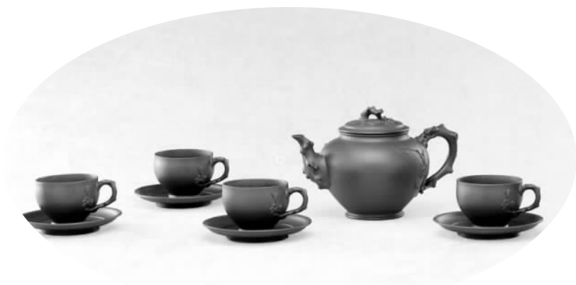
中国嘉德2014春拍，一套顾景舟制九头咏梅茶具以2875万元成交。