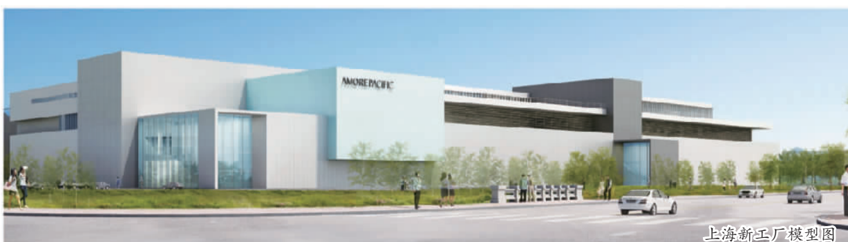
上海新工厂模型图

爱茉莉太平洋集团以“亚洲之美”为基础，致力于实现亚洲人的美丽之梦，进而与世界共同分享亚洲之美。同时为了携手人类共同探索可持续发展，不断研发可持续的产品以及开展各种各样的社会公益活动。