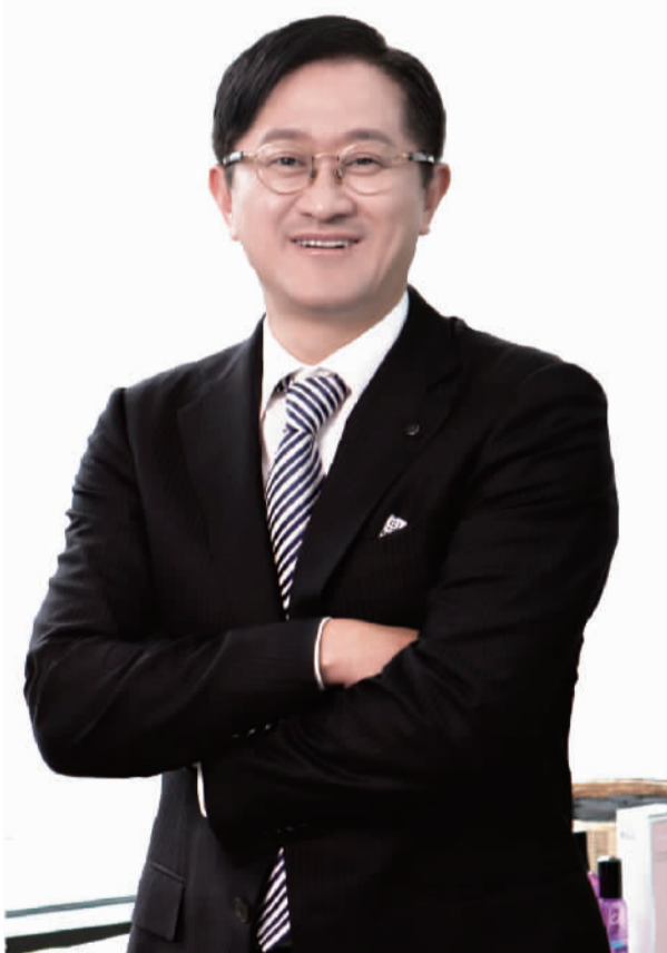
爱茉莉太平洋集团董事长徐庆培

爱茉莉太平洋中国一直坚持以消费者为中心的理念。为确保产品的高品质，充分了解中国消费者的需求，爱茉莉太平洋开展各种研究和调查活动。如针对中国消费者皮肤和头发对外部环境影响比较敏感的问题，爱茉莉太平洋上海研发中心与多所药科大学的皮肤科学部门共同开展多种合作研究项目，用传统草药开发革新原料，研发出帮助皮肤抵御外部影响的系列产品。2011年成立了由中国著名皮肤科专家组成的“爱茉莉太平洋-