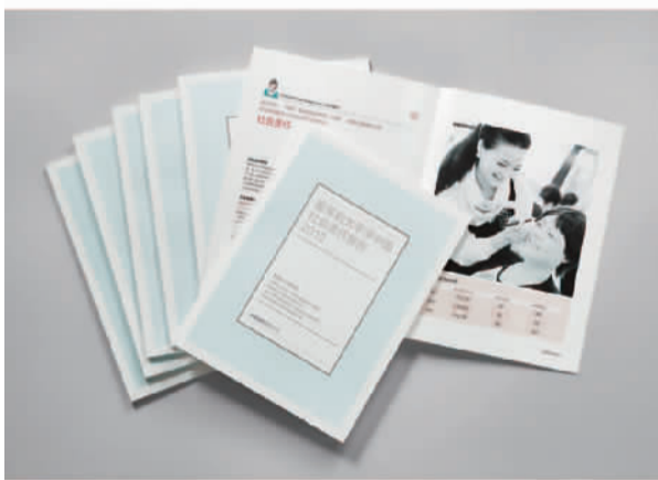
2013爱茉莉太平洋中国社会责任报告

秉承向全世界传递“亚洲之美”的特殊使命，凭借对人类和自然可持续发展的独特理解，日前，有“韩国最佳美容企业”之称的韩国最大化妆品集团爱茉莉太平洋集团制作了“2013爱茉莉太平洋中国社会责任报告”在中国首发。表明了爱茉莉太平洋中国深刻意识到承担企业社会责任和可持续发展的重要意义，并从顾客、环境、员工和社区的角度展现爱茉莉太平洋对中国市场长期深耕的承诺。