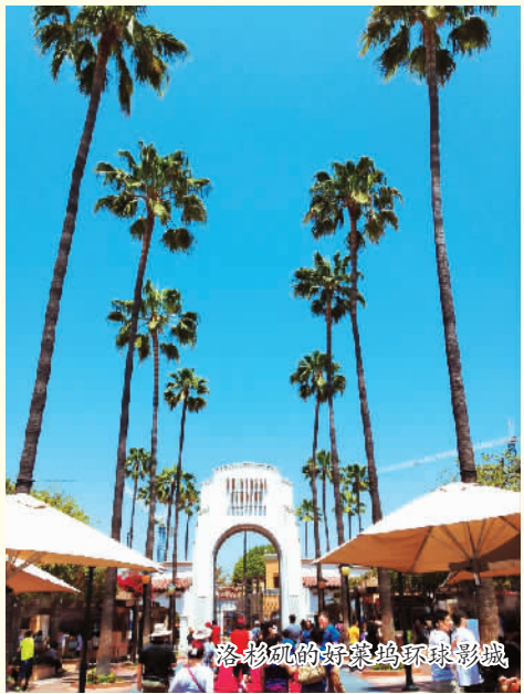
洛杉矶的好莱坞环球影城

“飞越加州”是最受游客喜爱的娱乐项目，冒险乐园负责人介绍说。对于害怕坐过山车的人来说，这是一个既能享受刺激又不会感到恐惧的模拟飞行体验。我们坐在升降椅上，双脚悬空，顿感自己飞了起来，一会