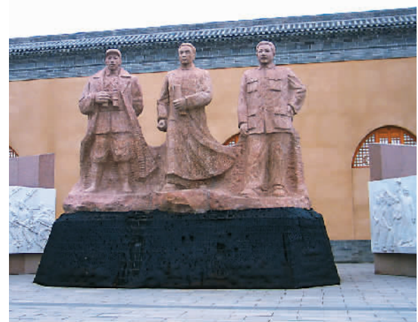
革命纪念馆前的雕像