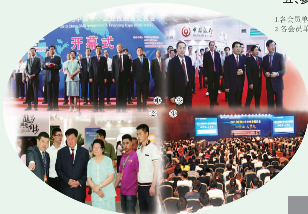
图1: 顾秀莲等领导出席2013首届投融资会开幕式 图2: 中国中小企业协会会长李子彬陪同顾秀莲巡馆 图3: 国家发改委连维良、工信部朱宏任等领导巡馆 图4: 2013首届主论坛盛况空前,1800人场地座无虚席

首届“投融资会”以“创新小微金融,优化金融配置;服务实体经济,助力中小企业”为主题,展出面积近2万平方米,参展机构达200余家,20000家企业参加交易会,展会接待观众约17,000人次,集中展示超过2,000种服务中小企业的金融产品,为广大中小企业选择适合自己需求的融资产品提供了机会。展期内对接项目合计3000多个,涉及金额