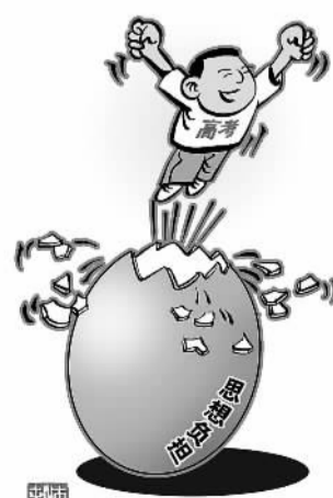
破“壳”而出 商海春作(新华社发)

而对时代的关注，则也是高考作文不变的内容。从20世纪80年代中期关注环境问题，2008年聚焦抗震救灾、2009年天津卷关注“90后”，到今年的作文题目中，普遍关注科技与现代化、城市化及其相关命题以及对基层、对真善美的价值观的追求，都体现出这一“不变”的精神内核。