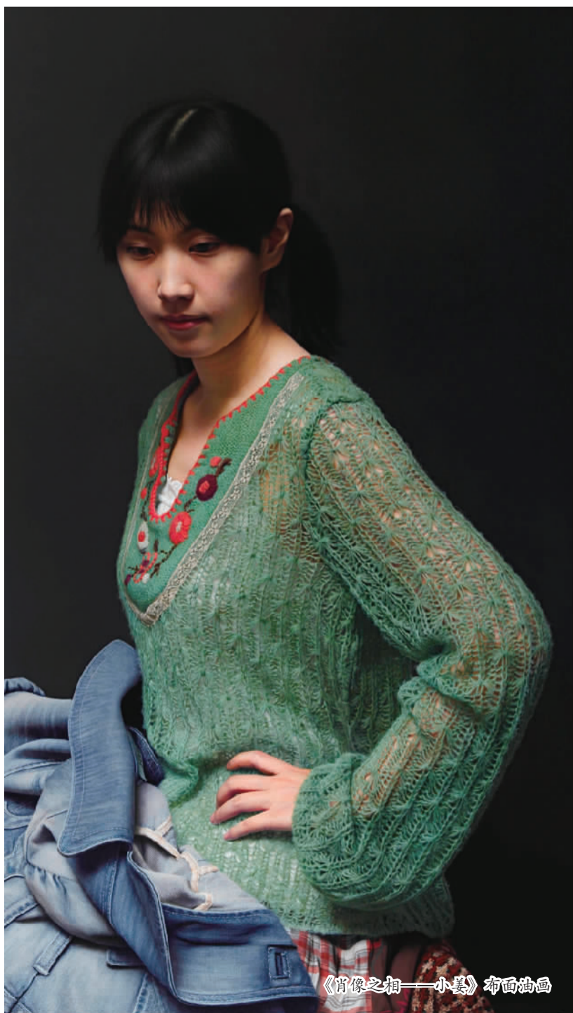
《肖像之相——小姜》布面油画