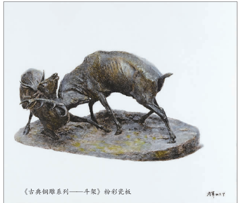
《古典铜雕系列——斗架》粉彩瓷板