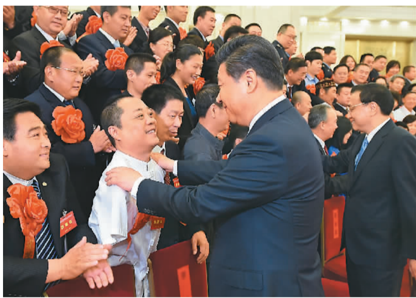
5月16日,党和国家领导人习近平、李克强、刘云山、张高丽等在北京人民大会堂会见第五次全国自强模范暨助残先进集体和个人表彰大会受表彰代表。

本报北京5月16日电(记者刘维海)第二十四次全国助残日到来前夕,中共中央总书记、国家主席、中央军委主席习近平16日上午在北京会见第五次全国自强模范暨助残先进集体和个人表彰大会受表彰代表,并发表重要讲话。他强调,残疾人是社会大家庭的平等成员,是人类文明发展的一支重要力量,是坚持和发展中国特色社会主义的一支重要力量。希望各位自强模范再接再厉,希望广大残疾人从自强模范身上汲取力量,自尊、自信、自强、自立,更加勇敢地迎接生活的挑战,更加坚强地为实现人生梦想、为实现我们的共同梦想而努力,推动我国残疾人事业在新的征程中不断迈上新台阶。