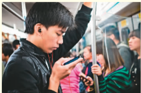
2012年10月12日,一名年轻人在北京地铁上使用手机。