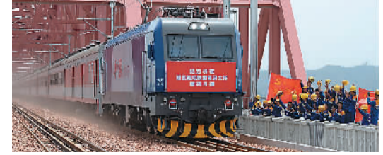
5月16日,黄河上首座四线铁路桥——郑焦城际铁路黄河大桥启用。图为铁路工人在向穿过郑焦城际铁路黄河大桥的第一辆客运列车欢呼致意。

长沙磁浮铁路连接长沙火车站和长沙黄花机场,全长18.5公里,设计最高时速120公里。工程建成后,乘客从高铁南站到黄花机场只需约10分钟。