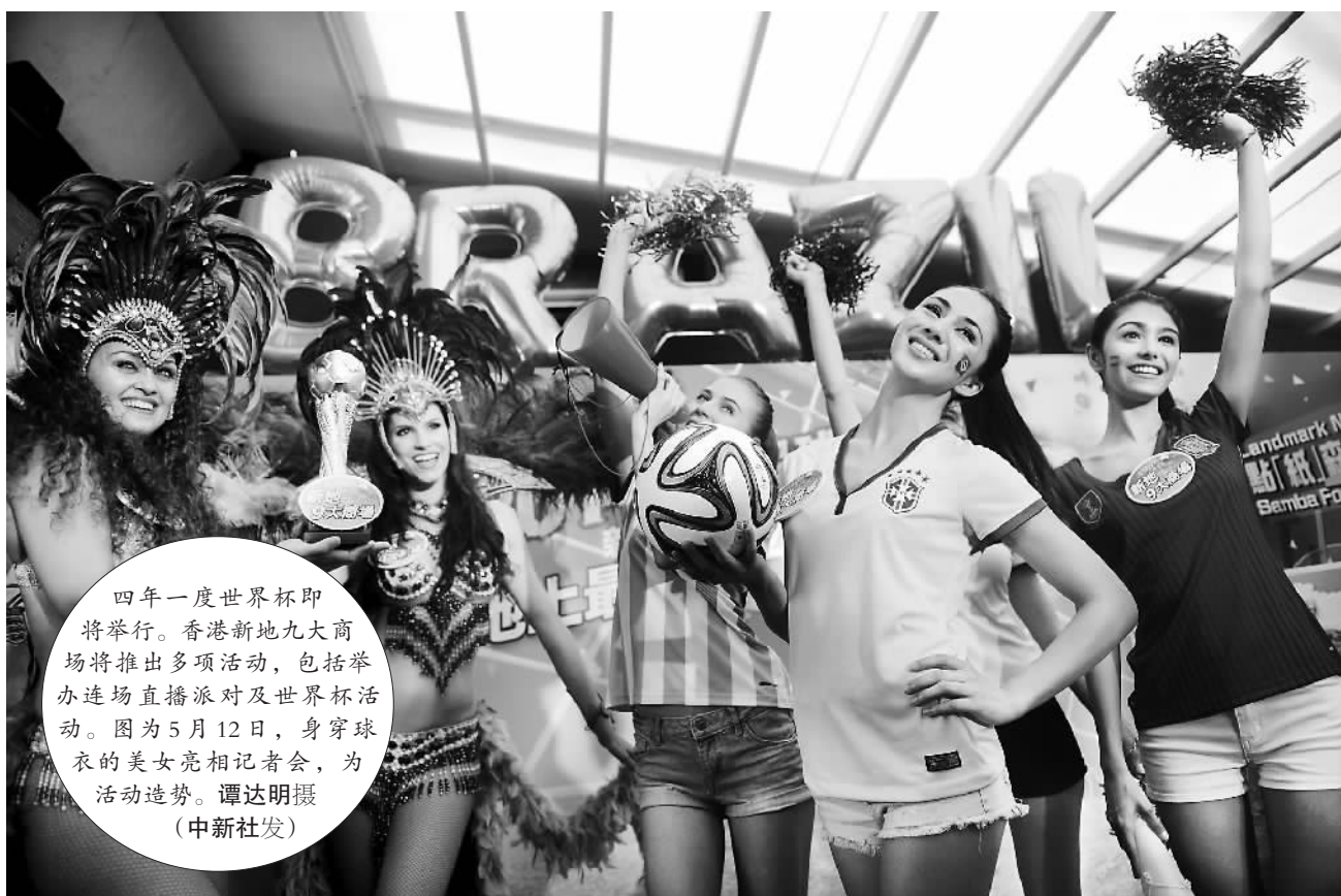
四年一度世界杯即将举行。香港新地九大商场将推出多项活动，包括举办连场直播派对及世界杯活动。图为5月12日，身穿球衣的美女亮相记者会，为活动造势。

马晓光说，不光是我的同事，在大陆的青年人当中有很多人使用HTC，而且很喜欢这款手机，因为大陆民众把它当做中华民族的品牌来使用而骄傲。你提到这个问题，它既是两岸企业之间的合作问题，当然要尊重企业的意愿，也涉及到就像刚才讲的，台湾当局对大陆的经贸政策和经贸管制问题。还是应该经济的归经济，其他的归其他。