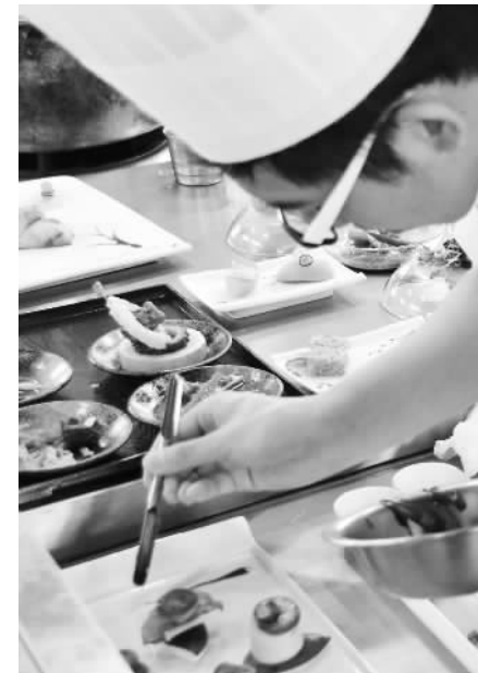
近日，台湾桃园县举办“桐花创意美食PK赛”，45队同台竞技，献上色香味俱佳的美食，展示客家好滋味。

作为香港最具规模的慈善公益机构，香港马会自上世纪80年代中期便关注、支持内地体育事业发展。除无偿赠送退役马匹、协助培训马术人才、服务北京奥运会及广州亚运会马术比赛外，还为中国体育彩票竞猜系列项目的开发提供了专业技术支持，并捐资建设了四川奥林匹克体育中心等。