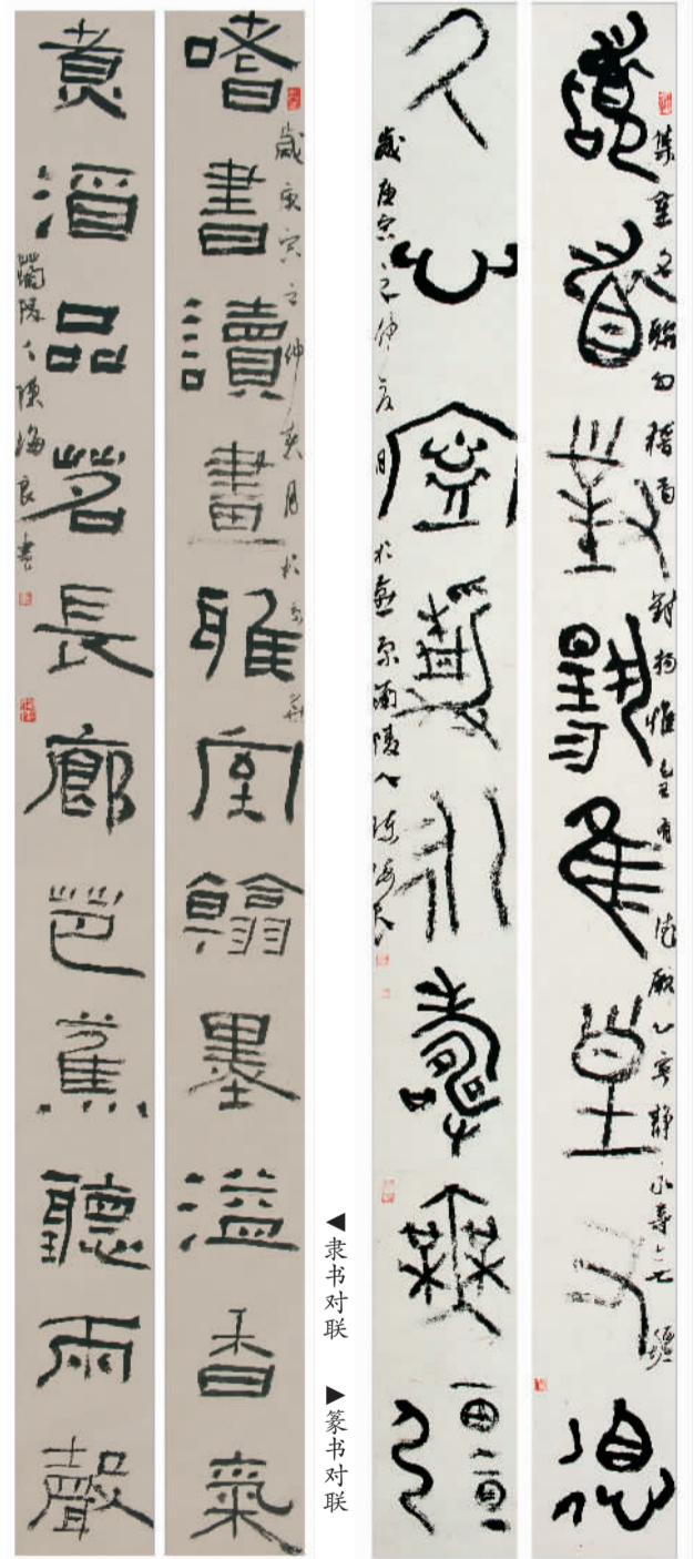
▲隶书对联 ▼篆书对联