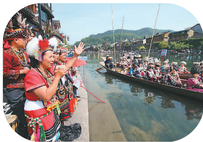
5月6日是苗族传统节日“四月八”，湖南凤凰苗族群众和活动邀请来的台湾屏东县的鲁凯族同胞相聚凤凰古城沱江畔，泛舟沱江对唱民歌，共享接龙宴，举杯庆佳节。图为鲁凯族同胞在江边和船上的苗族姑娘们对歌。