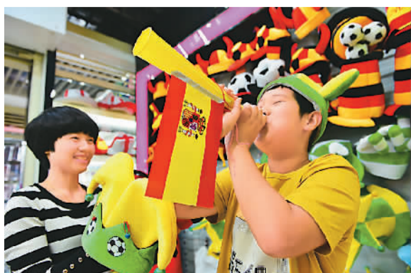
随着巴西世界杯的临近, 义乌国际商贸城内各类世界杯产品开始了最后一轮的销售高峰。图为一名小朋友正在展示参赛国的球迷用品。