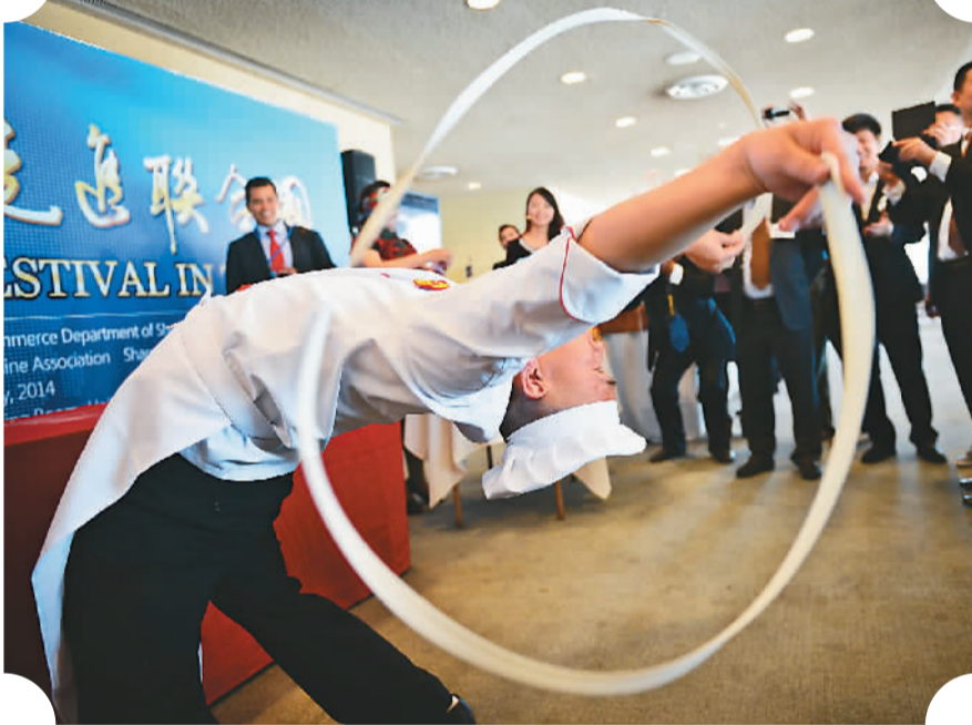
▲联合国副秘书长南威哲(右)尝试拉面。 ▲面食技师表演扯面技艺。