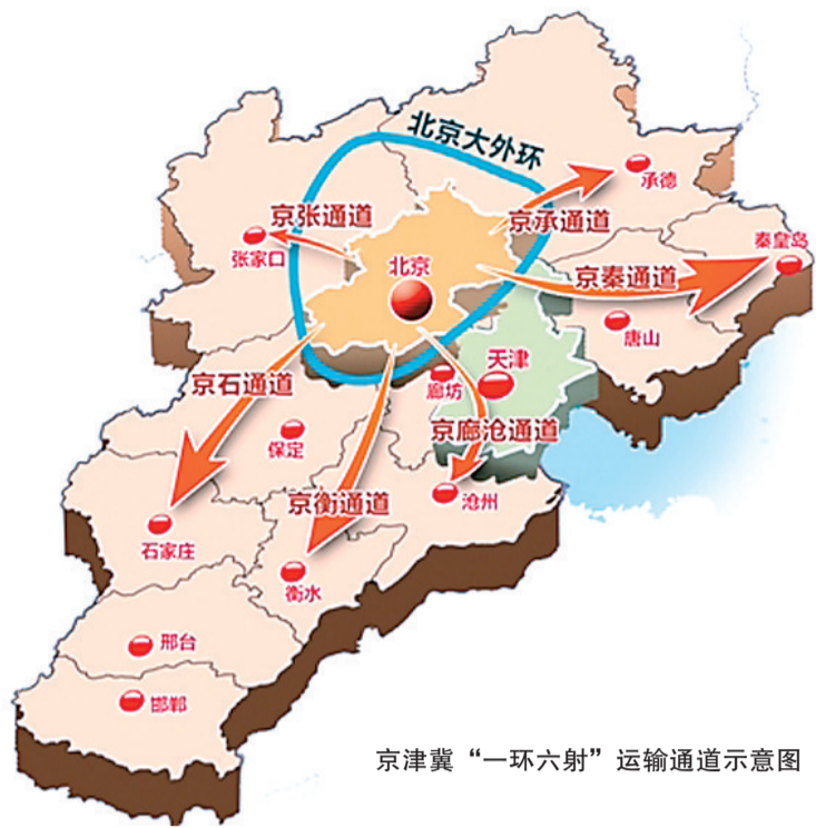
京津冀“一环六射”运输通道示意图

国家正在结合三省市的实际情况统一编制更长远的交通规划。按照规划，2020年将形成京津冀9500公里的铁路网和主要城市1小时城际铁路交通圈。北京市交通委目前正在编制未来三年的交通规划，该规划将把京津冀一体化作为重点，结合三地新的产业格局和城市布局调整北京交通网络。