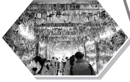
上图:5月3日,游客在玉龙雪山的许愿风铃下经过。

“五一”小长假期间,云南丽江吸引了各地游客纷至沓来,感受高原水域、皑皑雪山的魅力。