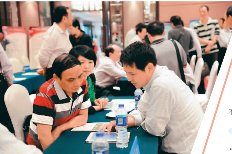
通过各类人才与项目洽谈会，越来越多的海归到厦门创业，带来了许多好项目。厦门市留学人员管理中心供图

目前，地方在发展产业化方面还存在明显不足。林志共认为，相较于科技创新，产业化对地方的发展同样重要。他曾多次和政府部门进行沟通，希望可以结合实际情