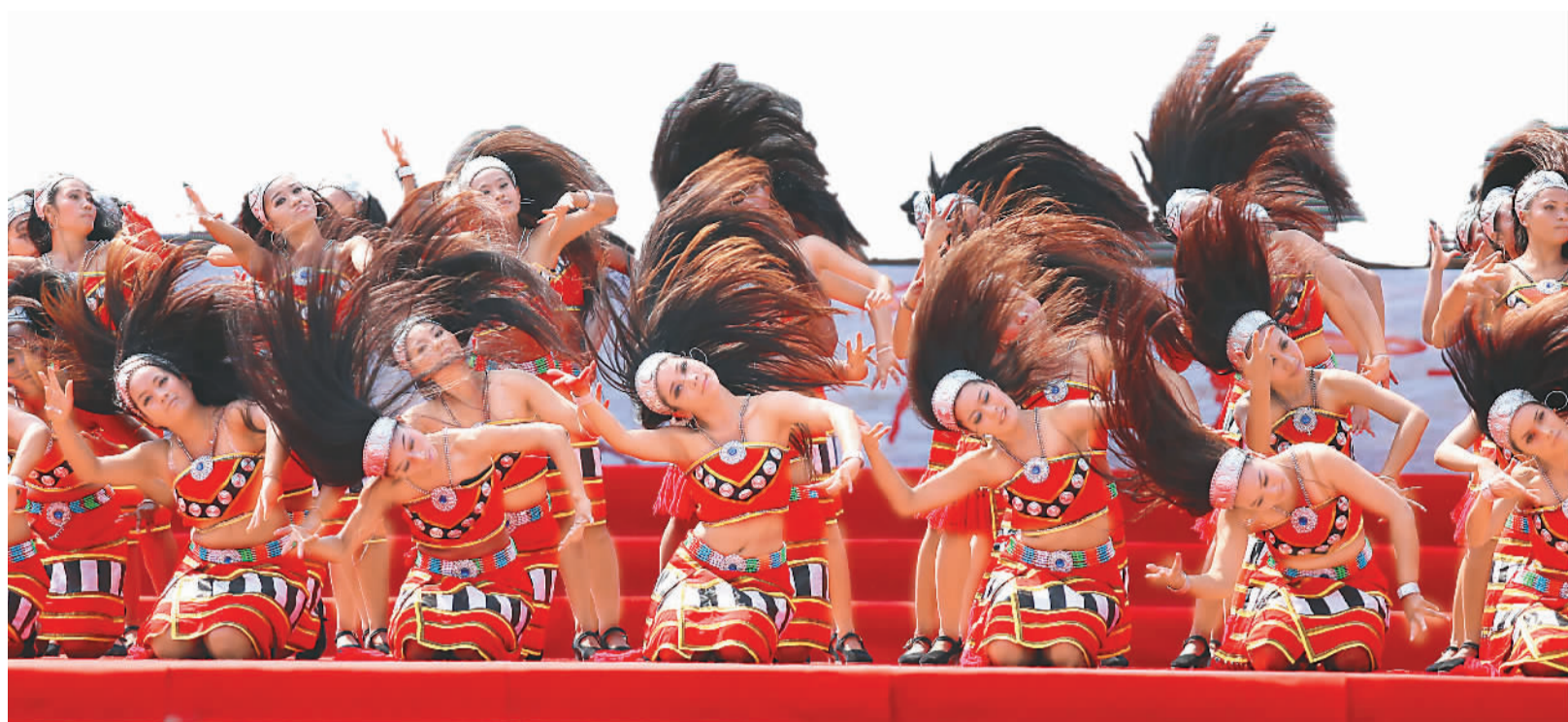
5月1日,云南省沧源佤族自治县各族群众载歌载舞欢庆建县50周年。沧源是中国最大的佤族聚集县,50年来,这里民族团结,经济发展,生活不断改善。图为演员在表演。