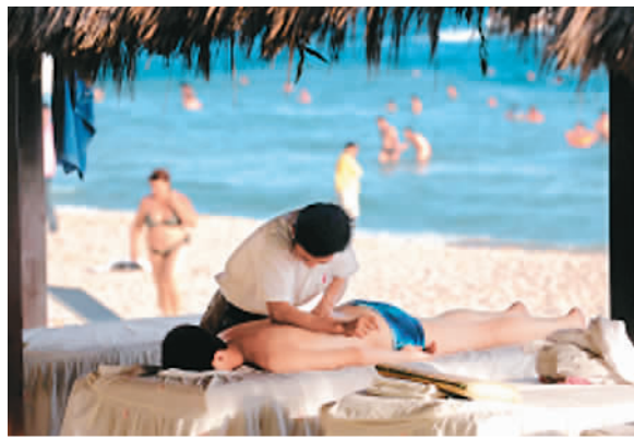
俄罗斯游客在三亚海滩享受中医按摩

这一情况或许很快会有改观。月初,海南省在博鳌举行乐城国际医疗旅游先行区新闻发布会,这一目前全国唯一由国务院审批、以医疗旅游为主导的第三产业园区,即将全面开工,其目标是成为新的世界养生胜地。