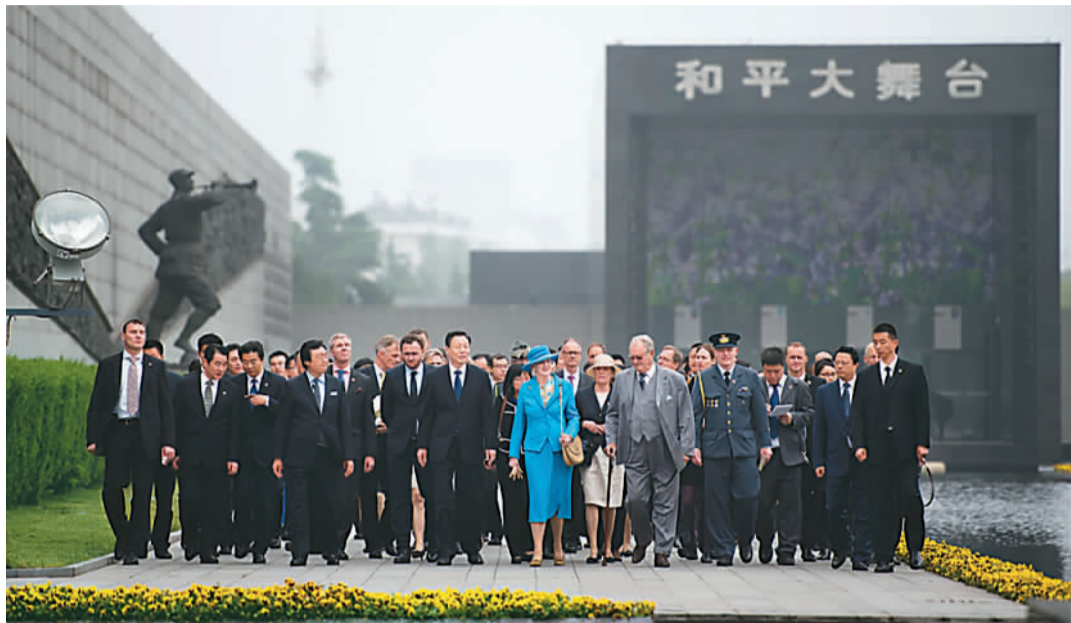
图为玛格丽特二世（前中着蓝色外套）走过和平广场。