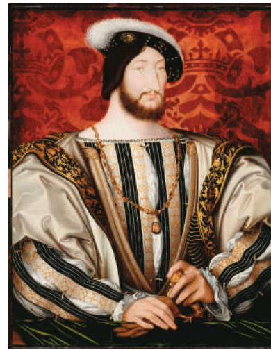
法国国王弗朗索瓦一世像 让·克鲁埃 卢浮宫博物馆藏

为了让观众真切感受到这些“镇馆之宝”的魅力，画作旁设置了展示牌、说明文字和视频播放器，除了展出的画作，还介绍了与这个流派相关的其他作品。主办方还编撰了一份相关的目录，让观众可以洞察从16世纪到20世纪的法国艺术演变。此外，展览还推出了手机APP、微信等讲解服务。“希望通过这些媒介工作，让并不熟悉法国历史和艺术的游客身临其境地欣赏这些画作。”让-保罗·克吕泽尔说。