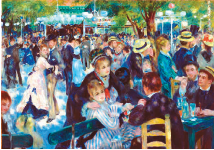
煎饼磨坊的舞会 奥古斯特·雷诺阿 奥赛博物馆藏