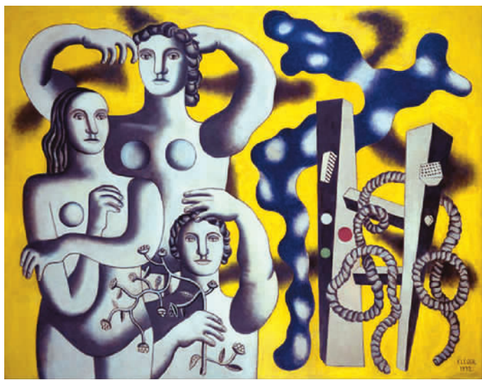
三个肖像的构图 费尔南·莱热 蓬皮杜现代艺术中心藏

日前，由中国国家博物馆与法国博物馆联合会共同主办的“名馆·名家·名作——纪念中法建交五十周年特展”亮相国博，囊括了法国5家著名博物馆的精品力作，为中国观众带来了一道丰美的法式艺术盛宴。此次展出的画作是法国艺术最杰出的代表作，时间跨越自文艺复兴时期至二战后，浓缩了500年的法国艺术史。