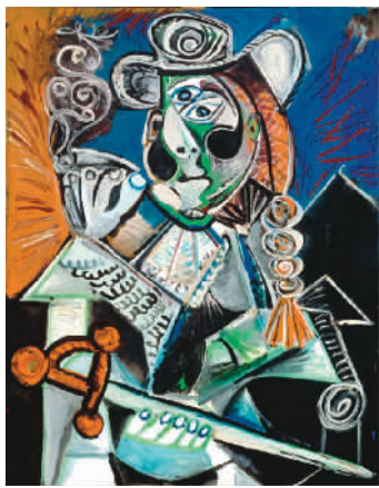
斗牛士 巴勃罗·毕加索 毕加索博物馆藏