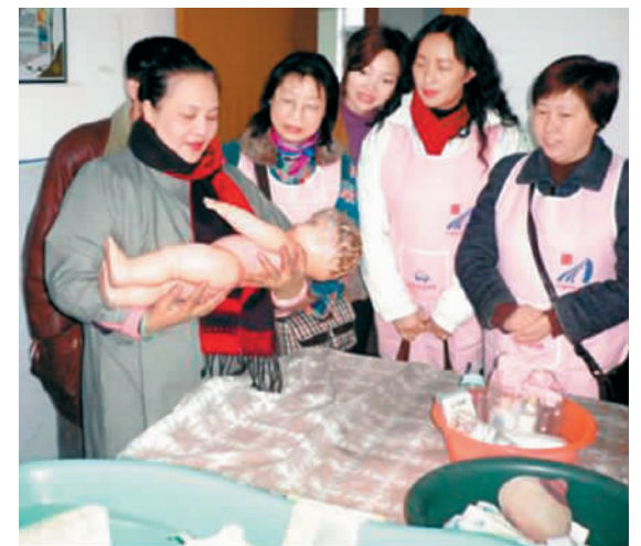
中国国家政员学校，对家务助理提供育婴、家务等多项训练。

当华人保姆团结起来，并且敢于发声时，保护自身权益时呼吁才会被社会重视，她们在海外才有可能真正“走俏”。