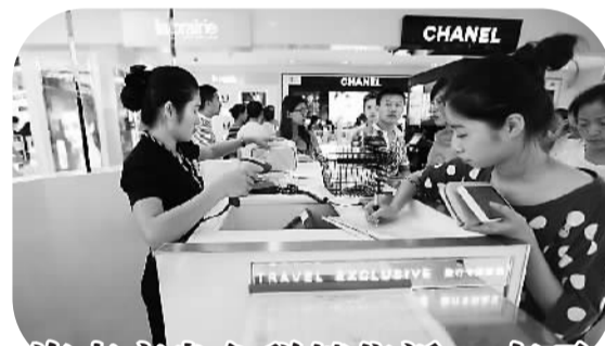
海南离岛免税销售近84亿元

据介绍,在5月1日之前和5月1日起推广实施7项制度:先进区、后报关制度;区内自行运输制度;加工贸易工单式核销制度;保税展示交易制度;境内外维修制度;期货保税交割制度;融资租赁制度。5月1日后至6月30日前分批推广和实施另7项制度:批次进出、集中申报制度;简化通关作业随附单证;统一备案清单;内销选择性征税制度;集中汇总纳税制度;保税物流联网监管制度;智能化卡口验放管理制度。