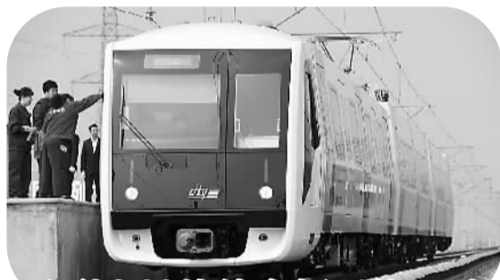
首列市域快轨车辆下线试乘

税务总局所得税司介绍,为落实小微企业税收优惠,税务总局已正式下发公告,明确小微企业享受优惠不再审批,同时明确以前不列入税收优惠范围的核定征税的小微企业这次也可以享受优惠政策。