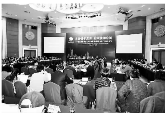
“坚持科学发展建设美丽中国”第四届深圳学术年会暨广东智库论坛会场