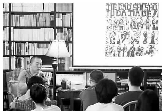
深圳书吧讲座丰富市民文化生活。