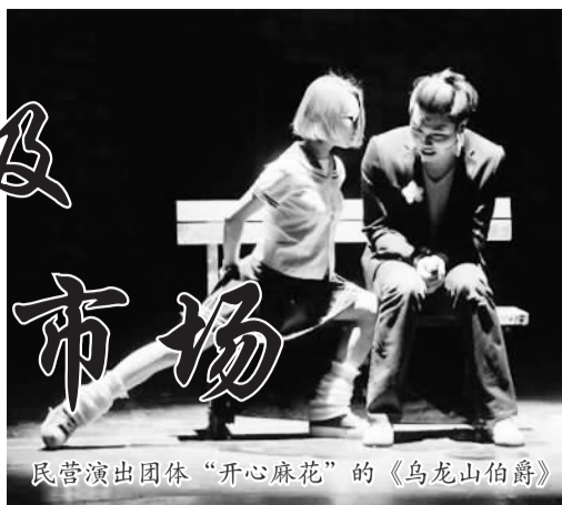
民营演出团体“开心麻花”的《乌龙山伯爵》

近日，中国演出行业协会发布《2013中国演出市场年度报告》（以下简称《报告》）。中国演出行业协会秘书长潘燕说，2013年对于中国演出市场而言是一个重要的转折点。“我国演出市场步入了转型升级的轨道，部分演出经营者逐步改弦易辙，从倚靠政府转而面向市场。”