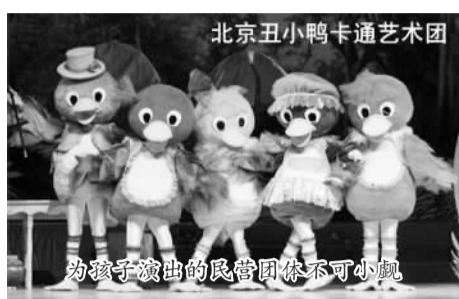
为孩子们演出的民营团体不可小觑

近日，中国演出行业协会发布《2013中国演出市场年度报告》（以下简称《报告》）。中国演出行业协会秘书长潘燕说，2013年对于中国演出市场而言是一个重要的转折点。“我国演出市场步入了转型升级的轨道，部分演出经营者逐步改弦易辙，从倚靠政府转而面向市场。”