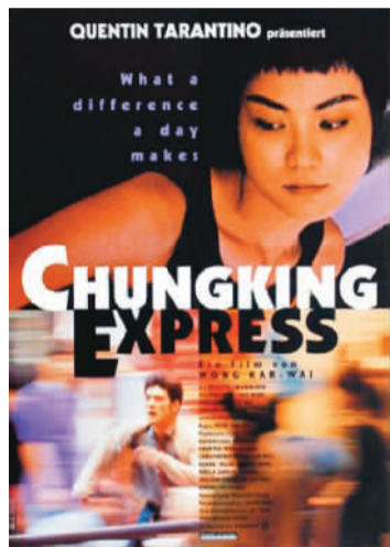
《重庆森林》电影海报