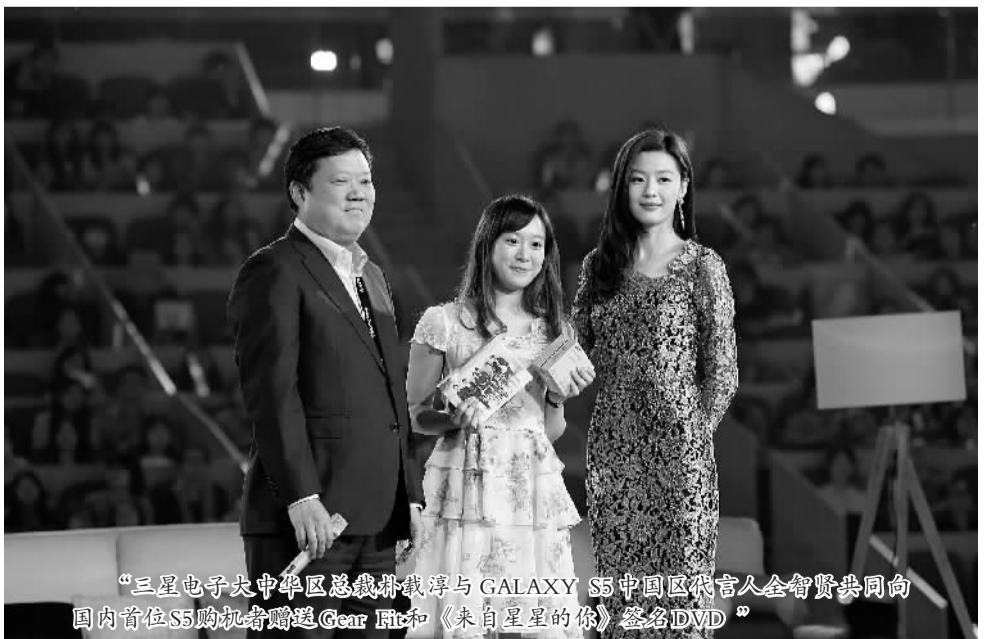
“三星电子大中华区总裁朴载淳与 GALAXY S5 中国地区代言人金秀贤、全智贤共同向国内首位 S5 购机者赠送 Gear Fit 和《来自星星的你》签名 DVD”

作为三星史上最成功的 GALAXY S 系列的最新型号, GALAXY S5 凭借内外兼修的多项创新将用户体验提升至更高境界,为消费者带来性能更为卓越的智能伴侣。这款走在智能手机发展前沿的新旗舰,在这场令人无比羡慕“星光派对”中展现出独一无二的风采,让在座星粉们深感认同和欣慰。