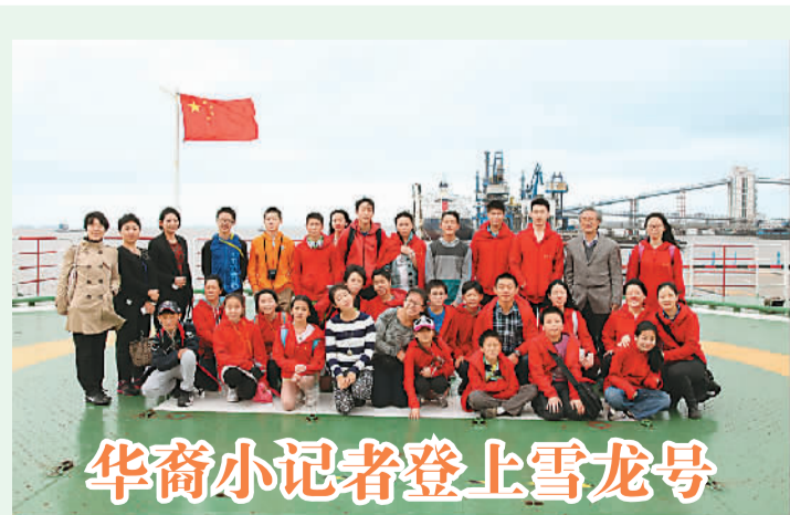
华裔小记者登上雪龙号

馆、联合国中国书会以及在联合国工作的各国外交官和工作人员共百余人出席了庆祝活动。4月20日是中国农历“谷雨”。2010年,联合国正式将每年中国农历的“谷雨”定为“联合国中文日”,以推广中文在联合国工作中的运用。