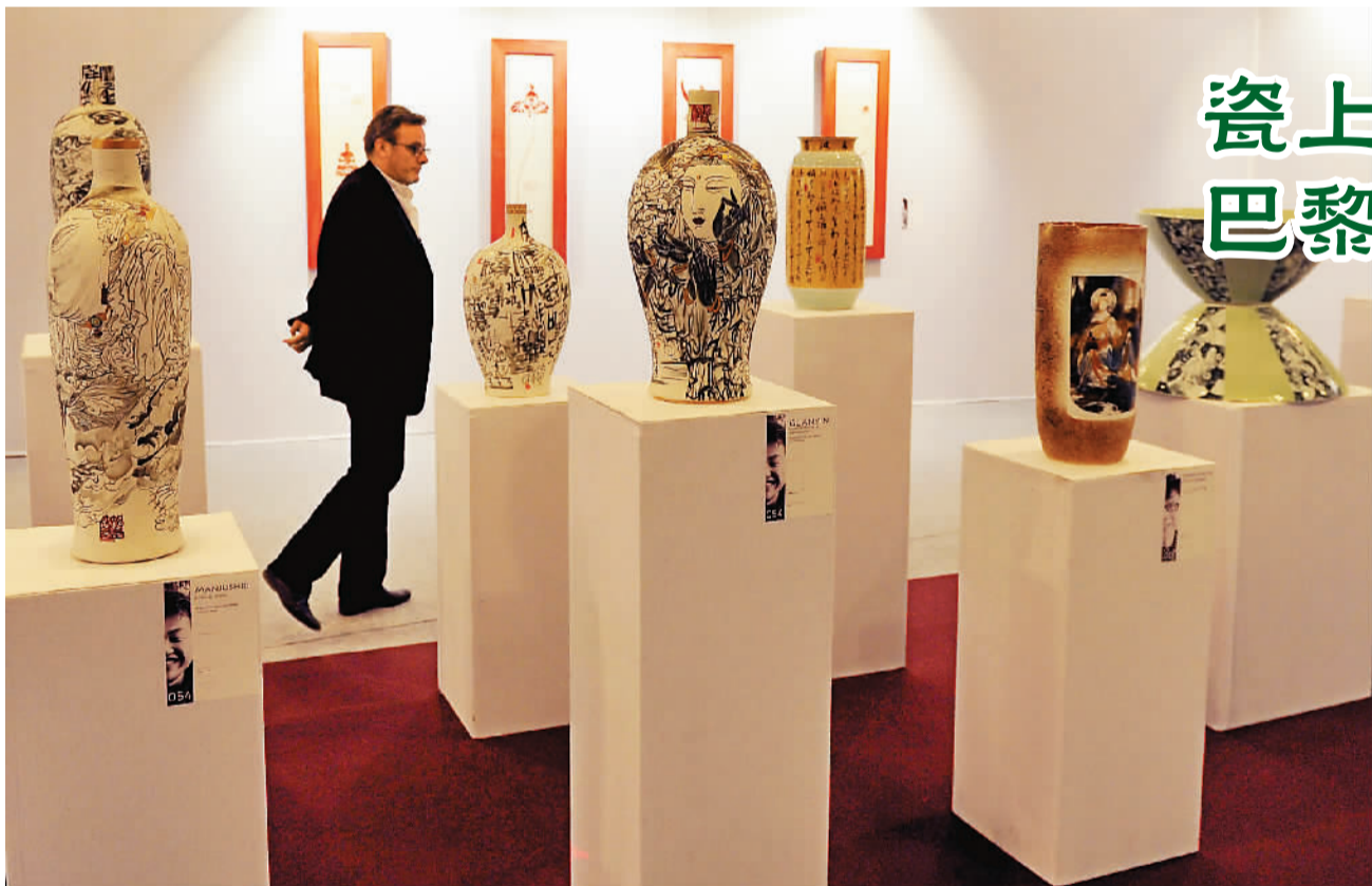
瓷上敦煌 巴黎开展

4月17日,为纪念中法建交50周年,为期一周的“视觉中国·瓷上敦煌”中国陶瓷艺术展在巴黎卢浮宫开幕。93位中国艺术家携135套共计1353件当代陶艺精品参展。