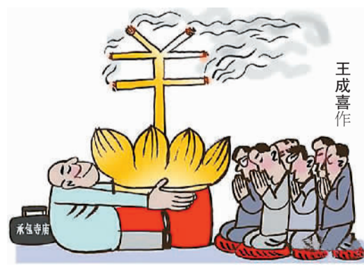
公布去年十大典型案例