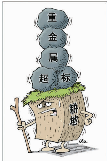
不堪“重”负 新华社发 徐肇作

根据国务院决定,2005年4月至2013年12月,环境保护部会同国土资源部开展了首次全国土壤污染状况调查。调查的范围是除香港、澳门特别行政区和台湾省以外的陆地国土,调查点位覆盖全部耕地,部分林地、草地、未利用地和建设用地,实际调查面积约630万平方公里。