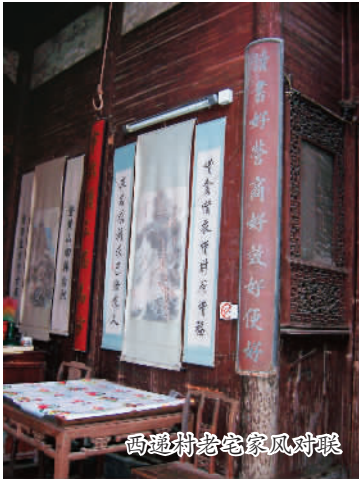
西递村老宅家风对联

我们慕名走进了被誉为“家风村”的安徽省黟县西递村，去欣赏“家风奇观”。 西递村在黟县城东8公里处，四面环山，世为胡姓聚族而居之地。清道光年间鼎盛时期，全村共有600座华丽的宅院，两条大街，99条深巷，90多口水井，人口近万。历经沧桑直到今天，还奇迹般地完好保存下来300多幢明清古建筑及其组成的古村落群。这些宅院名字儒雅：西园、桃李园、惇仁堂、履福堂，瑞玉庭、大夫第，还有枕石小筑……如诗如画，异彩纷呈，美不胜收，西递村被联合国教科文组织授予“世界文化遗产”。