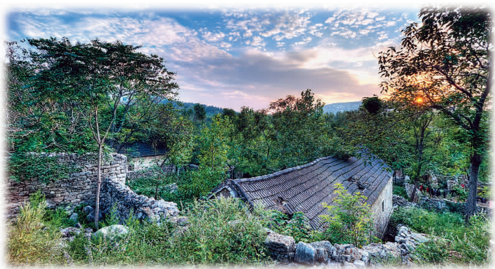
上九村一瞥