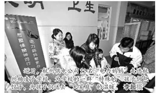
近期，湖州供电公司12名“电力妈妈”走进湖州物校小学，为该校的一群“特殊”留守儿童包饺子，为孩子们送去“关爱”的温暖。

30年，宗新民不知磨坏了多少双鞋子，摔坏了多少手表，被撕坏了多少衣服。现在他仍然在每次出门前都会带上公安部门发给他的证件，随时做好抓小偷的准备。（钱英）