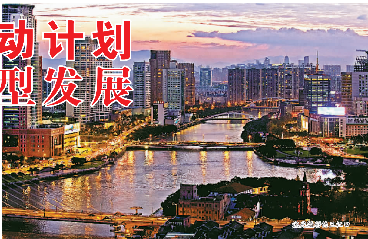
流光溢彩的三江口

为全面落实“双驱动”“四治理”决策部署，宁波市委、市政府今年启动实施经济社会转型发展三年行动计划，通过一批大项目、好项目的建设促转型、带发展。