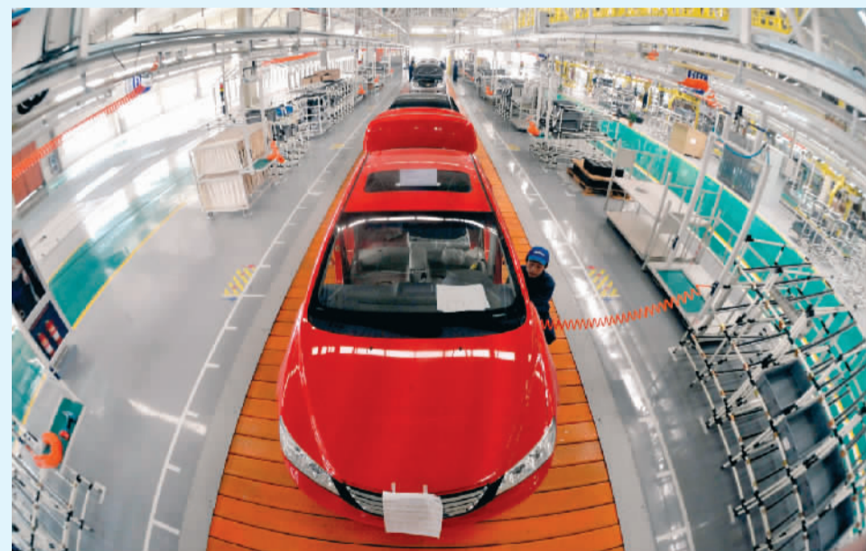
▲吉利汽车生产车间