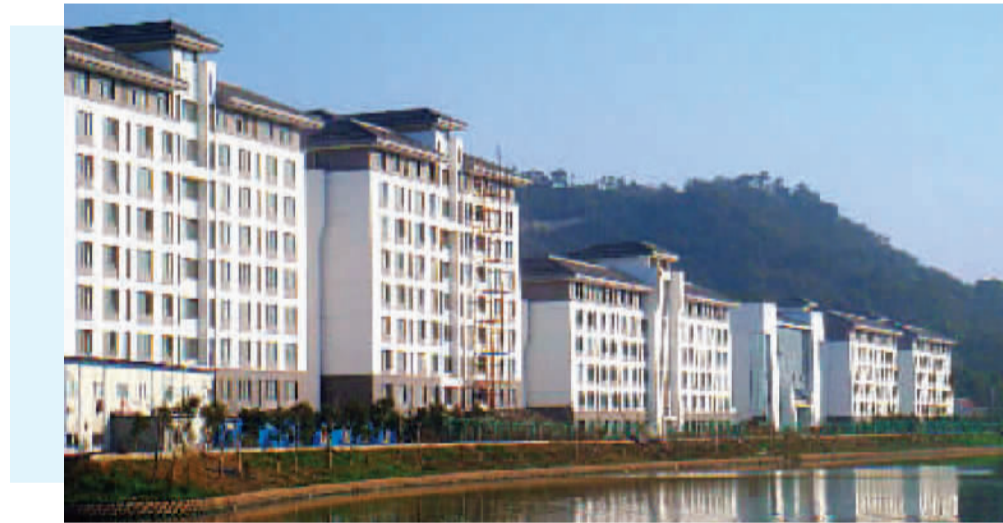
▲宁波市老年疗养院

八项行动是指继续推进“三改一拆”专项行动，全力落实“六小十题”整治行动、稳步推进生活垃圾分类行动、持续开展城市道路清爽行动、继续深化街面巡控保序行动、切实加强建筑垃圾整治行动、着力实施安全监管长效提升行动、全面加强轨道交通建管保障行动。