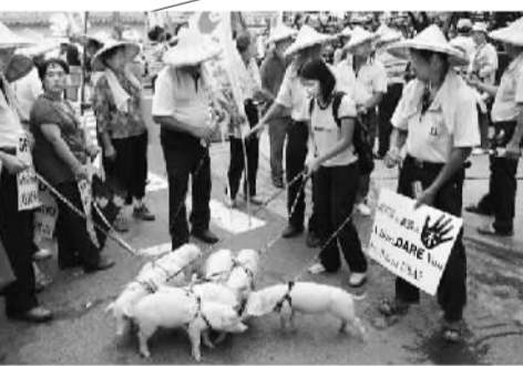
台湾猪农曾多次“击退”过美国猪肉的进口，这是2007年的抗议场景。(资料图片)

“牛猪分离”，意思明白，台湾已经在进口美牛。2012年，美牛闯关的过程，绝对是当年岛内最大的热点。当年的7月25日，台湾“立法院”通过了美国牛肉进口法案，给迁延许久