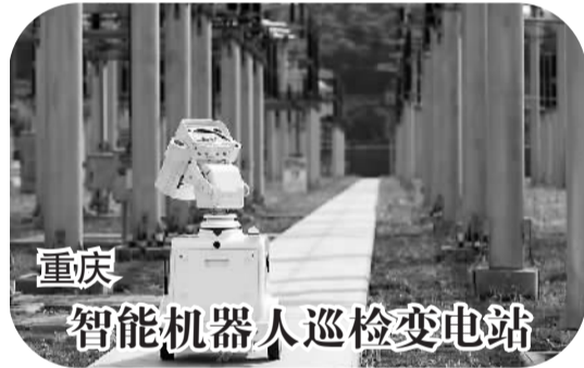
重庆 智能机器人巡检变电站

内蒙古自治区是我国集体林地面积最大的省区，拥有集体林地3.27亿亩，约占全国集体林地总面积的1/8。内蒙古从2004年起开展集体林权制度改革试点工作，2009年全面推行集体林权制度改革。截至目前，内蒙古共完成集体林地确权面积3.26亿亩，确权率为99.82%。