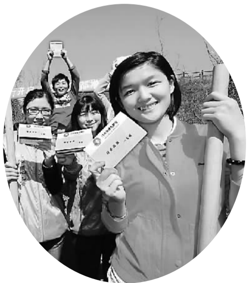
▲首批“储户”展示“存折”