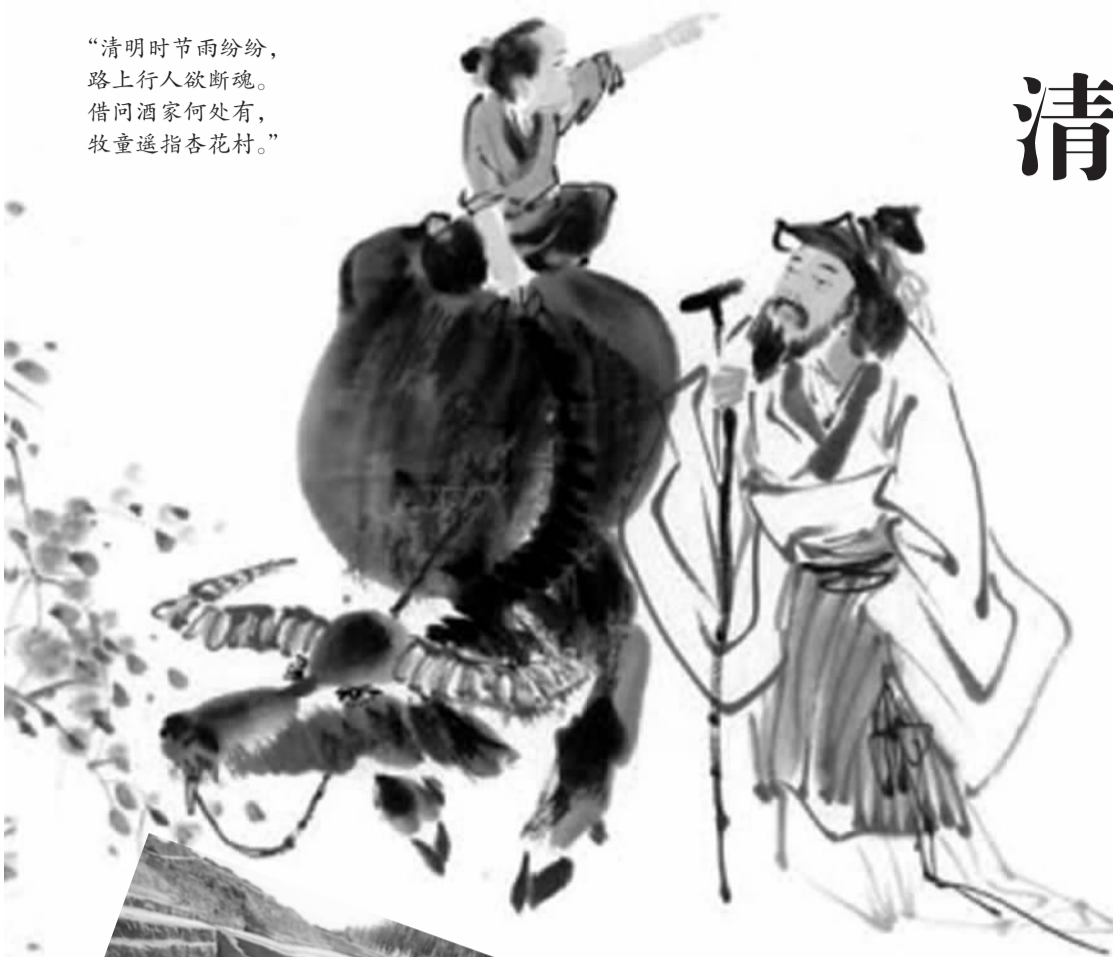
“清明时节雨纷纷，路上行人欲断魂。借问酒家何处有，牧童遥指杏花村。”

中国古代墓葬，作为一种旅游资源，不仅历史悠久，种类也相当丰富——不仅包含了上述帝王陵寝，还有古代名人的家墓、圣林、王侯冢以及少数民族特有的崖墓等等。这些古代墓葬，是特定历史时期社会