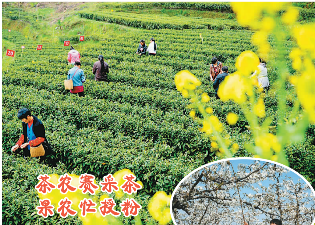
茶农赛采茶 果农忙授粉

湖北省恩施土家族苗族自治州宣恩县吕律坝村日前举办明前茶采摘比赛,以促进采茶质量的提高。宣恩县是湖北省重要的茶叶产地,目前茶叶种植面积约15万亩。大图: 参赛选手在进行采茶比赛。