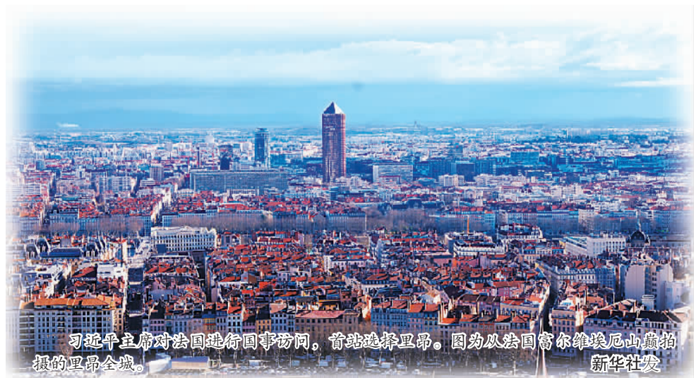
习近平主席对法国进行国事访问,首站选择里昂。图为从法国富尔维尔厄山拍摄的里昂全城。