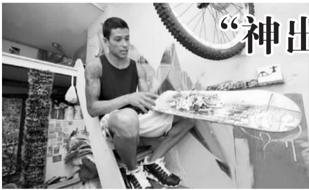
格罗耶的3D立体涂鸦

论坛举办十多年来，海内外游客对博鳌乡村多有探寻。留客村蔡家大院因此颇有知名度，先后接待了日、美、意等多国首脑，许多游客也慕名前来。图为3月25日拍摄的焕然一新的蔡家大院。