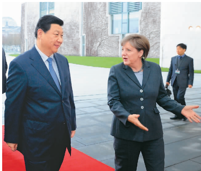
3月28日,习近平在柏林同默克尔举行会谈。

中国国务院副总理刘延东、俄罗斯副总理戈洛杰茨以及中俄两国社会各界、青年代表近2000人出席了开幕式。