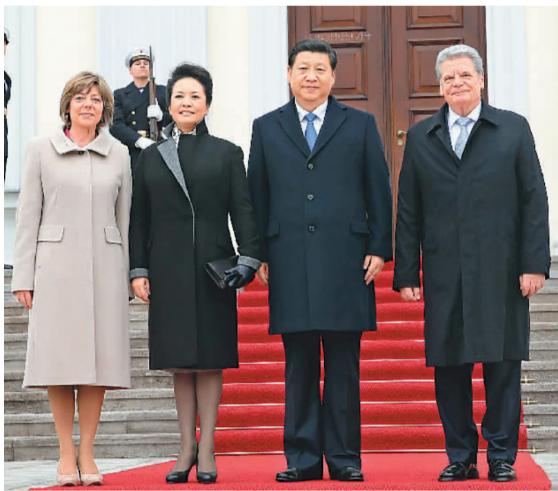
3月28日,习近平在柏林会见高克。

本报柏林3月28日电(记者杜尚泽、黄发红)国家主席习近平28日在柏林会见德国总统高克。双方就中德关系及共同关心的问题坦诚深入交换意见。